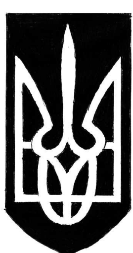
Герб национал-буржуазной Украины